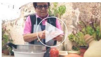
Cap.1.2 Conserva de tomata