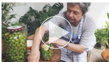
Cap.1.1 Olives trencades