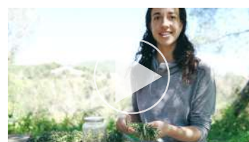
Cap.3.2 El romaní