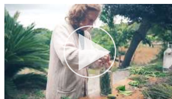
Cap.3.1 Herbes eivissenques